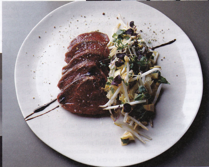
Sashimi de filet de boeuf Yogi et coeur de palmier frais by /von Chef JÉRÉMY ROSENBOIS, Cru, Paris