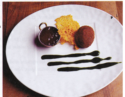
Rôti d'oeuf mollet, royal de Mornay, tuile de parmesan, jus crémeux d'épinards by /von Chef YVES CAMDEBORDE, Le Comptoir du Relais, Paris